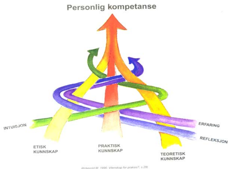
Figur 1 Personlig kompetanse (Kirkevold 1996:29)

personlig, ved at faglige og personlige handlinger utføres på bakgrunn av verdimeslige hensyn (ibid.).