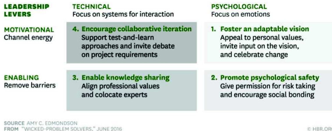
Tabell 1. Kjennetegn ved team som håndterer endring.