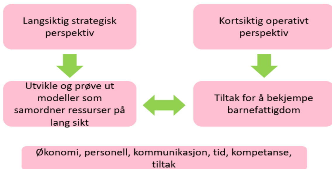
Figur 1, Strategisk og operativ organisering i kommuner. Bearbeidet etter Nilsson (2017)

To prinsipper, prinsippet om ministerstyre og mål- og resultatstyring, legger rammer for samordning (Nesheim og Neby, 2017). Det er dermed større utfordringer med tiltak som organiseres på tvers av etater enn med dem som organiseres i én etat. Kommuner og regional stat og fylkeskommuner er organisasjoner. Veldig forenklet er det mulig å peke på at organisasjoner er delt inn i en strategisk del der beslutninger fattes og en operativ del der tjenester ytes (Røiseland og Vabo, 2016). I den strategiske delen finner vi kommunens toppledelse og enhetsledere. I den operative delen finner vi profesjonelle tjenesteytere og deres nærmeste ledere (Nilsson, 2017). I dette prosjektet forholder vi oss til begge disse delene av kommunal organisasjon – både der beslutninger av langsiktig karakter fattes og der de kortsiktige, operative tiltakene settes i verk. Den operative delen av kommunen spiller en viktig rolle for å iverksette gode tiltak for å redusere barnefattigdom og er i kontakt med barn og ev. deres familier. Å redusere barnefattigdom krever intensivt og inkluderende samarbeid på strategisk og operasjonelt nivå (Voest, Verhoest og Molenveld, 2015). Figur to under viser strategisk og operativ inndeling.